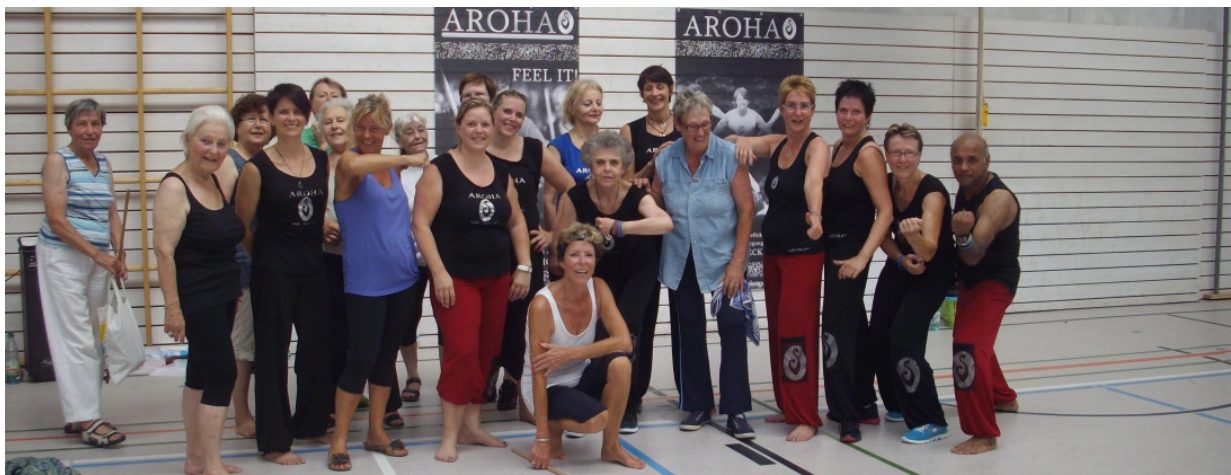
Gruppenfoto vom AROHA® Workshop am 18. Juli 2015 in der GSS.