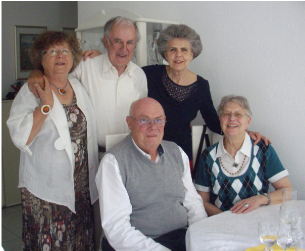
Siebzehn Jahr blondes Haar?

Nein, siebzig Jahr graues Haar! Wo ist die Zeit geblieben, wo ist sie hin??? Der 70. Geburtstag ist eine gute Gelegenheit zurückzublicken und auf das Erreichte stolz zu sein. Ich kann mich nun nicht mehr mit „Ü 60“ brüsten, nein. Meinen Start in die Lebensjahre von 70 bis...? habe ich schon hinter mir. Ehrlich zugegeben macht die Zahl nachdenk-