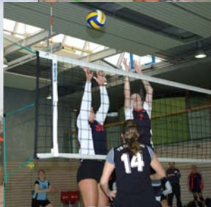
Fotos von Punktspielen der Frauen und Herren I sowie vom Sylvesterbeach 2007.