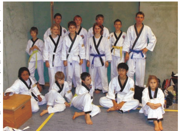
Aufnahme von der 4. German Champ. 25.11.06 Kassel.

In dem Zusammenhang sei noch erwähnt, daß die Hap-Ki-Do-Gruppe am 30.06. beachtenswerte Leistungen bei einer Vorführung auf der Adlerwiese in Praunheim zeigte, und zwar beim Jubiläum des Siedlerver-